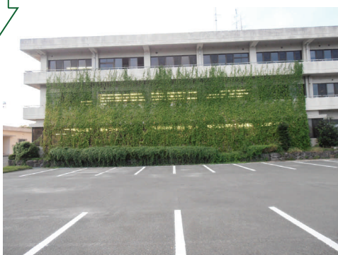
【立派なゴーヤも実り、見事なグリーンカーテンの完成】